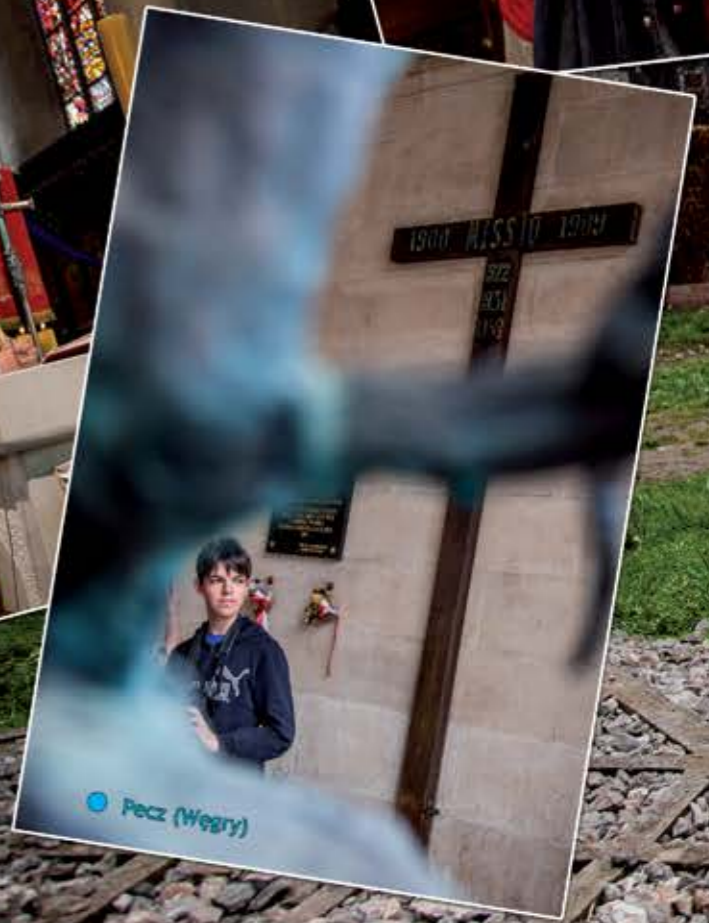
• Pecz (Węgry)