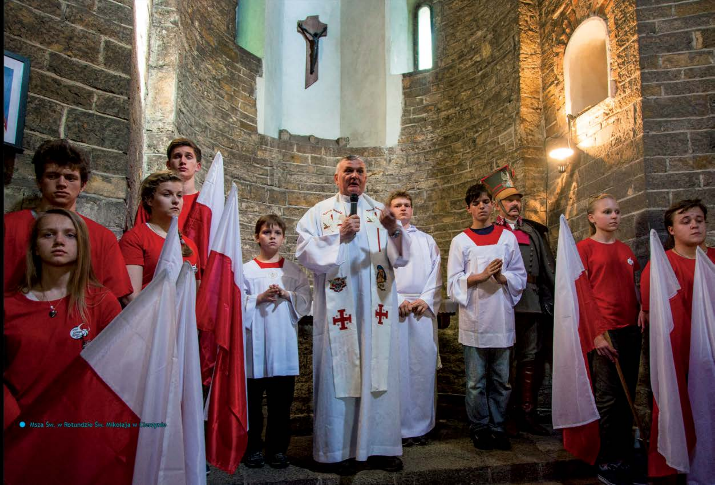
● Msza Św. w Rotundzie św. Mikołaja w Cieszynie

4 maja 2014, Kościół w Pałtinosie (Rumunia)