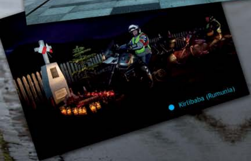
• Kirtibaba (Rumunia)