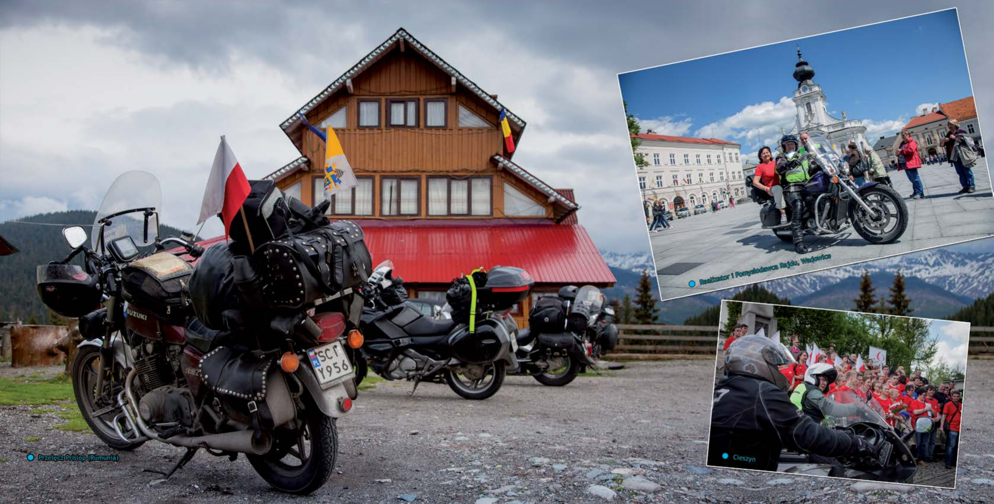
● Przełęcz Prislop (Rumunia)