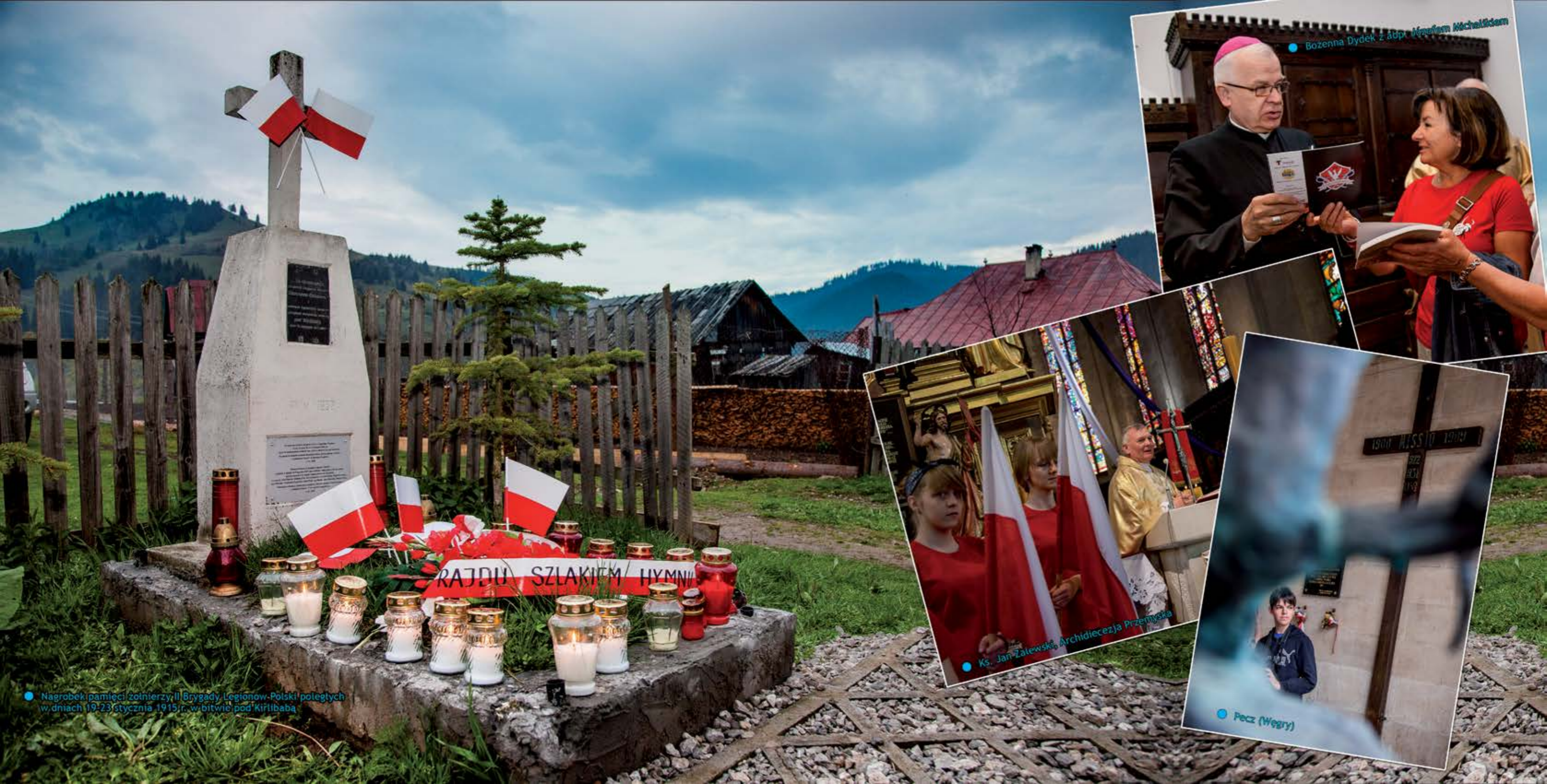
• Nagrobek pamięci żołnierzy II Brygady Legionów-Polski poległych w dniach 19-23 stycznia 1915r. w bitwie pod Kirlibabą