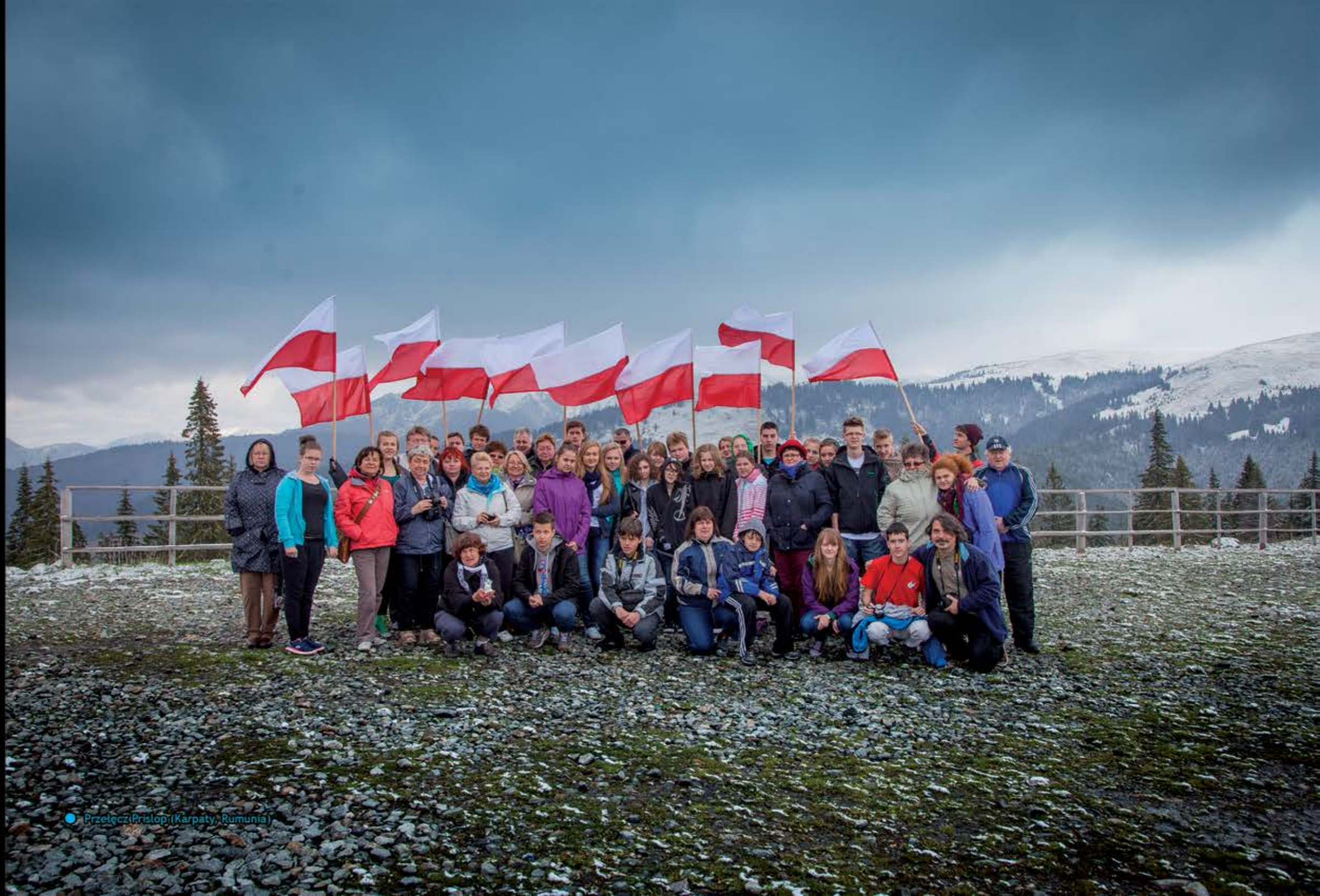
● Przelęcz Prislup (Karpaty, Rumunia)