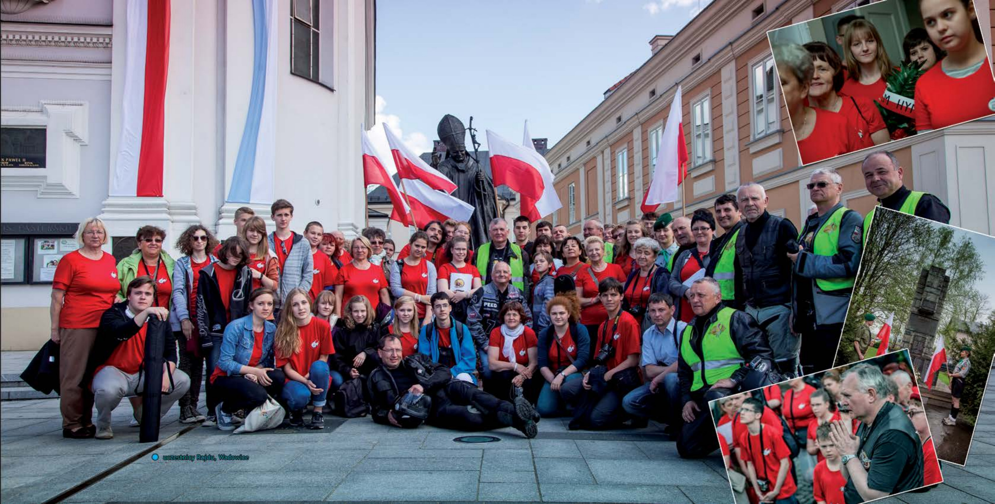
uczestnicy Rajdu, Wadowice