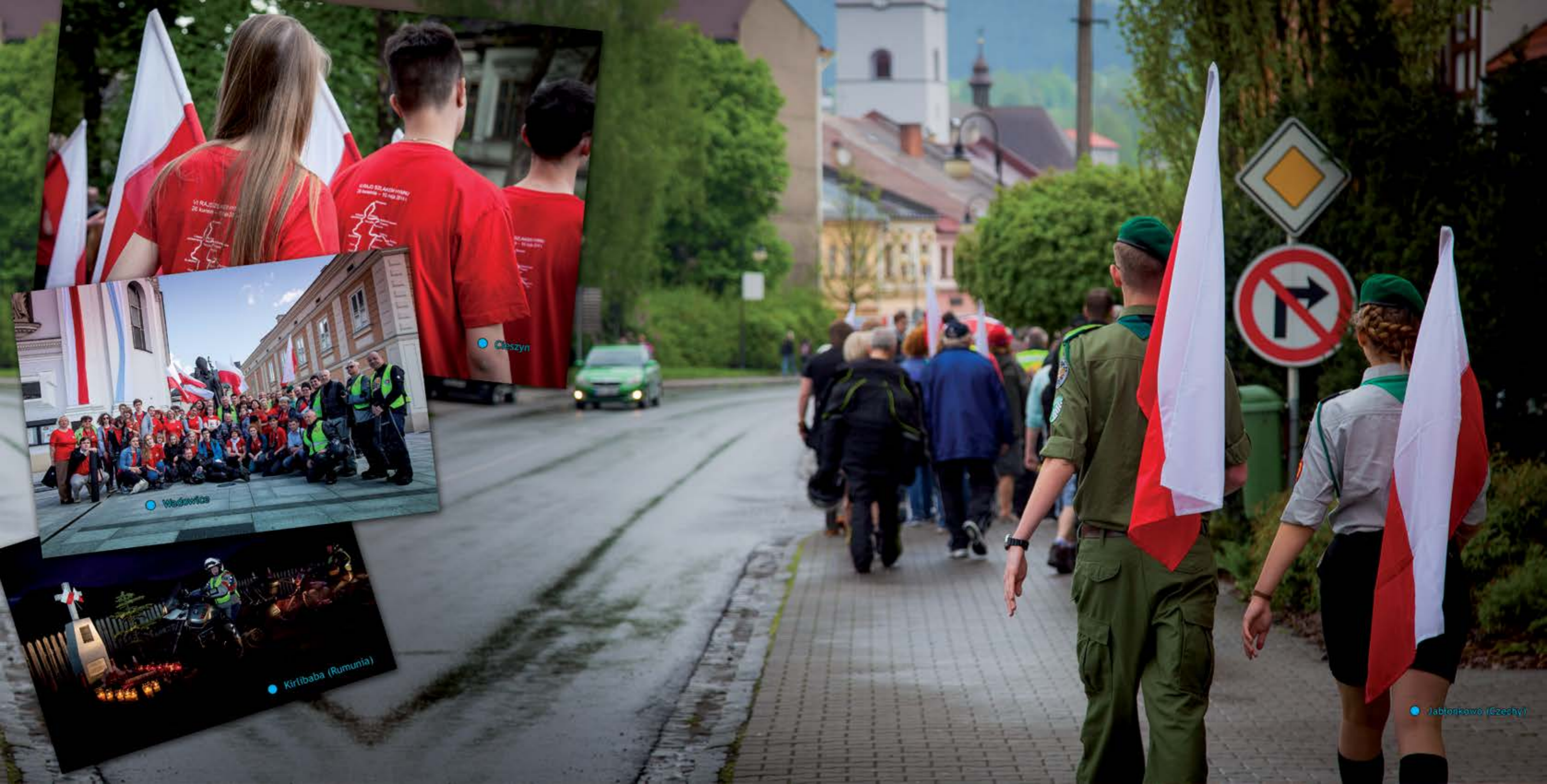
• Jabłonkovo (Czeszy)