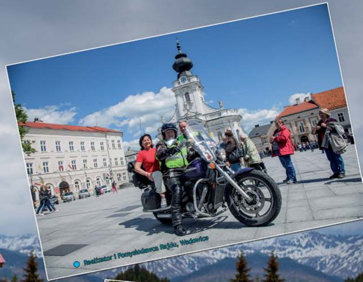
● Realizator i Pomysłodawca Rajdu, Wadowice