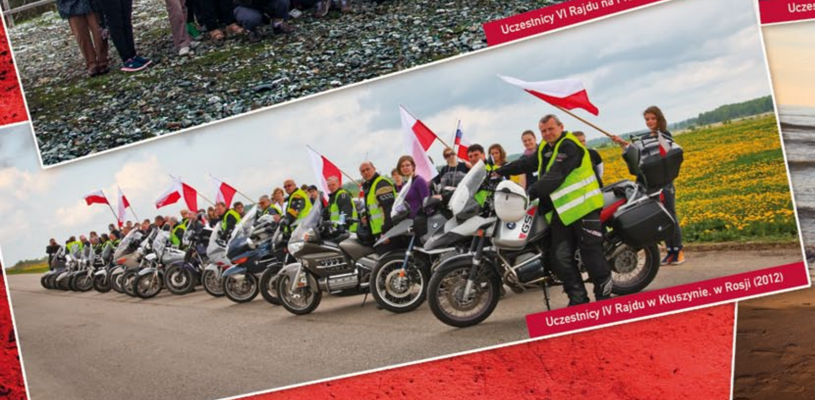
Uczestnicy IV Rajdu w Ktuszynie, w Rosji (2012)