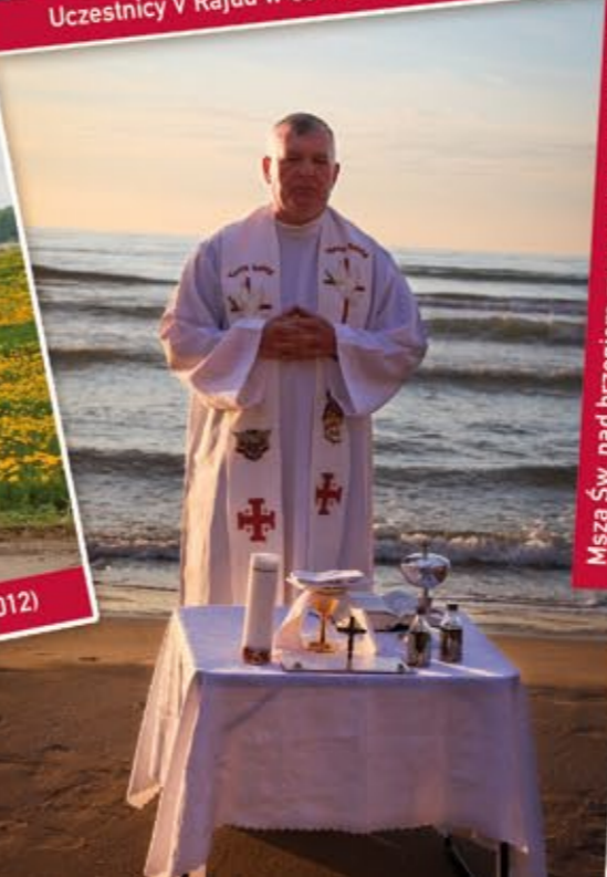
Msza Św. nad brzegiem morza w Hiszpanii (2013)