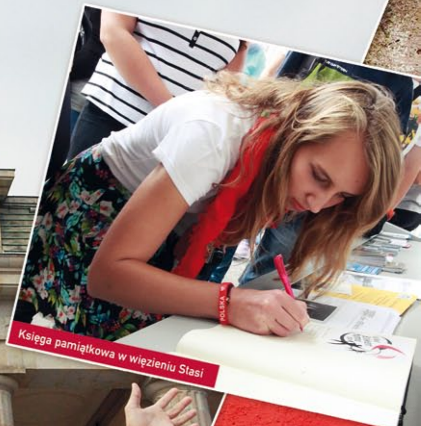
Księga pamiątkowa w więzieniu Stasi