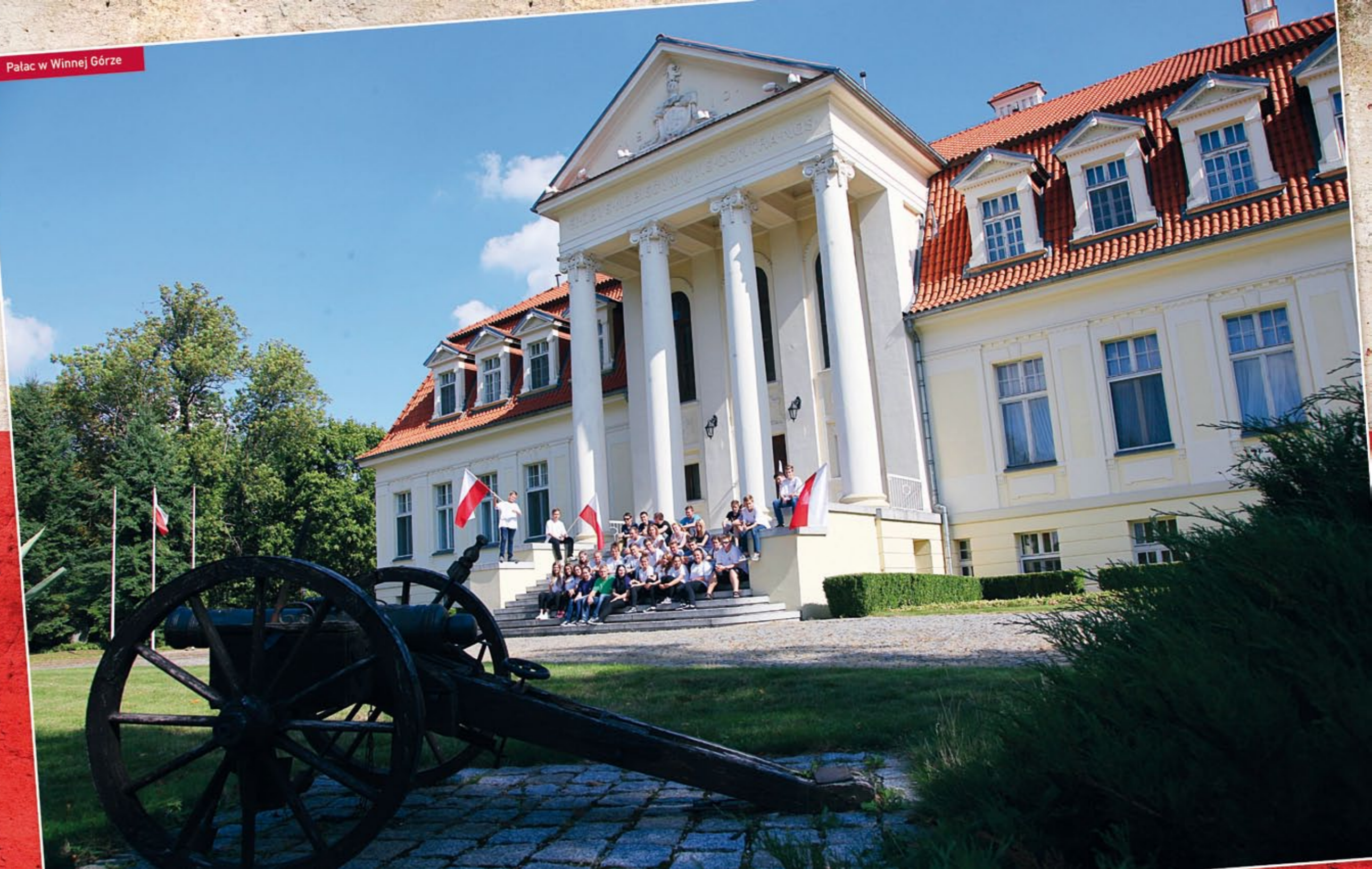
Pałac w Winnej Górze

konfederat barski, senator, wojewoda 1747-1822”. Urna z sercem generała Dąbrowskiego i prochy Józefa Wybickiego znalazły się w krypcie zasłużonych Wielkopolan w Poznaniu – kolebce polskości. Tu w farze Poznańskiej historia wielkich Polaków wzbudza dumę, zmusza do refleksji, modlitwy. Tu się czuje prawdziwie... „jeszcze Polska nie zginęła, kiedy my żyjemy”.