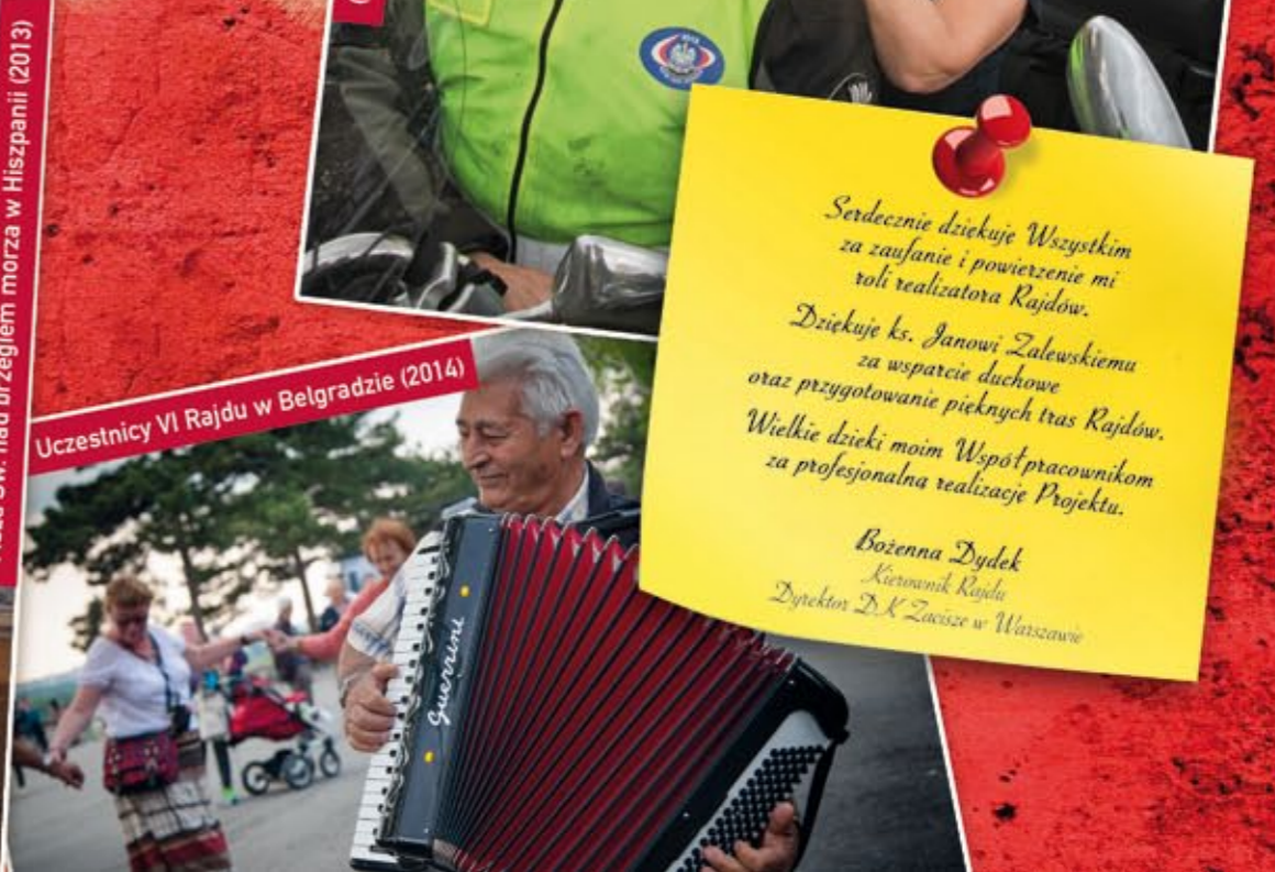
Uczestnicy VI Rajdu w Belgradzie (2014)