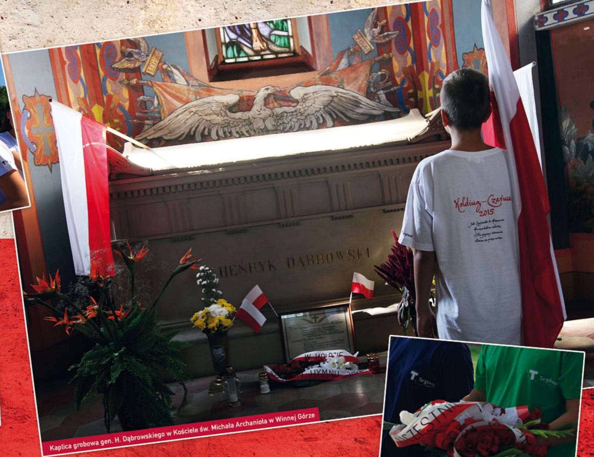
Kaplica grobowa gen. H. Dąbrowskiego w Kościele św. Michała Archanioła w Winnej Górze