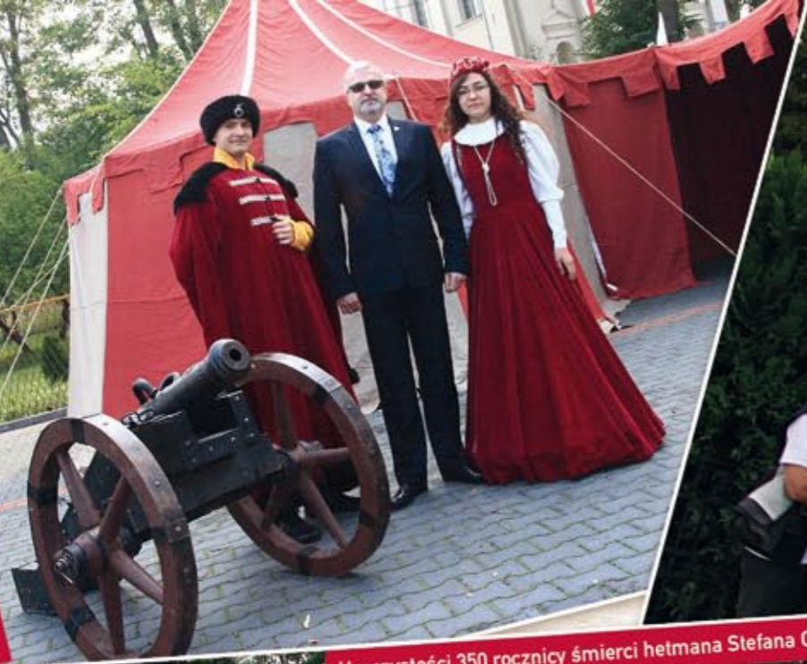
Uroczystości 350 rocznicy śmierci hetmana Stefana Czarnieckiego w Czarncy