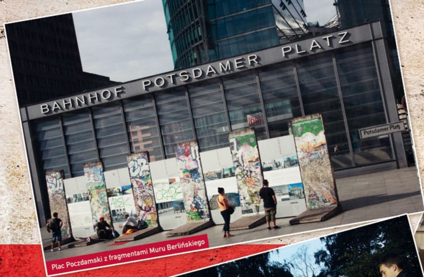
Plac Poczdamski z fragmentami Muru Berlińskiego