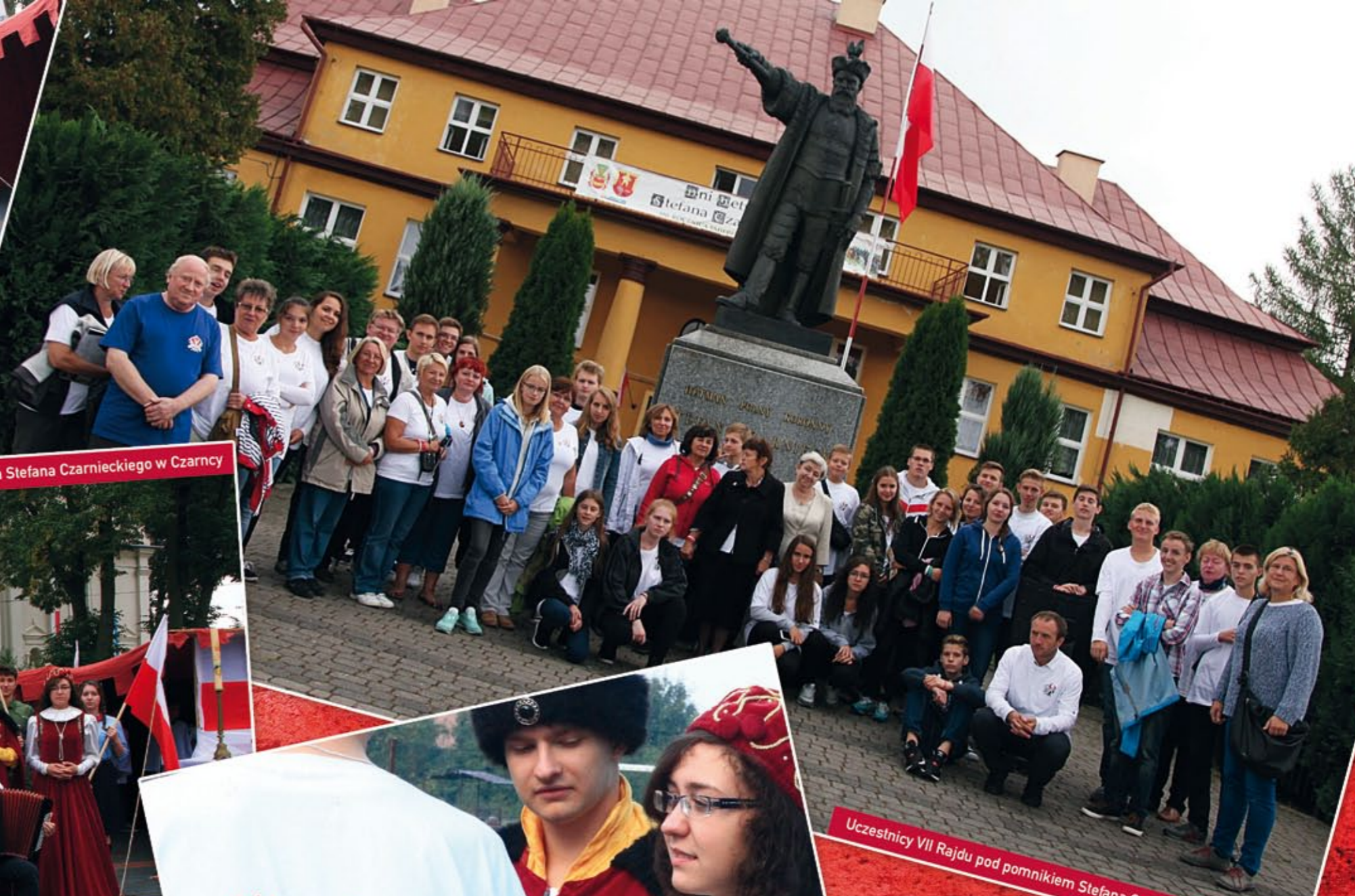
Uczestnicy VII Rajdu pod pomnikiem Stefana Czarnieckiego w Czarncy