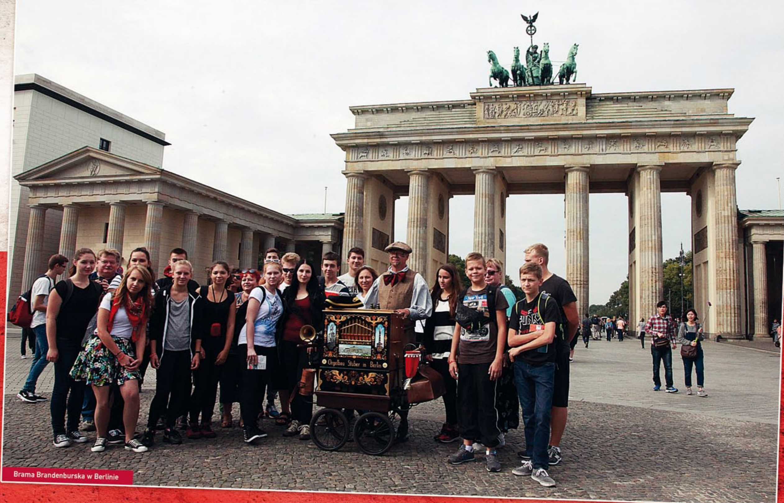
Brama Brandenburska w Berlinie