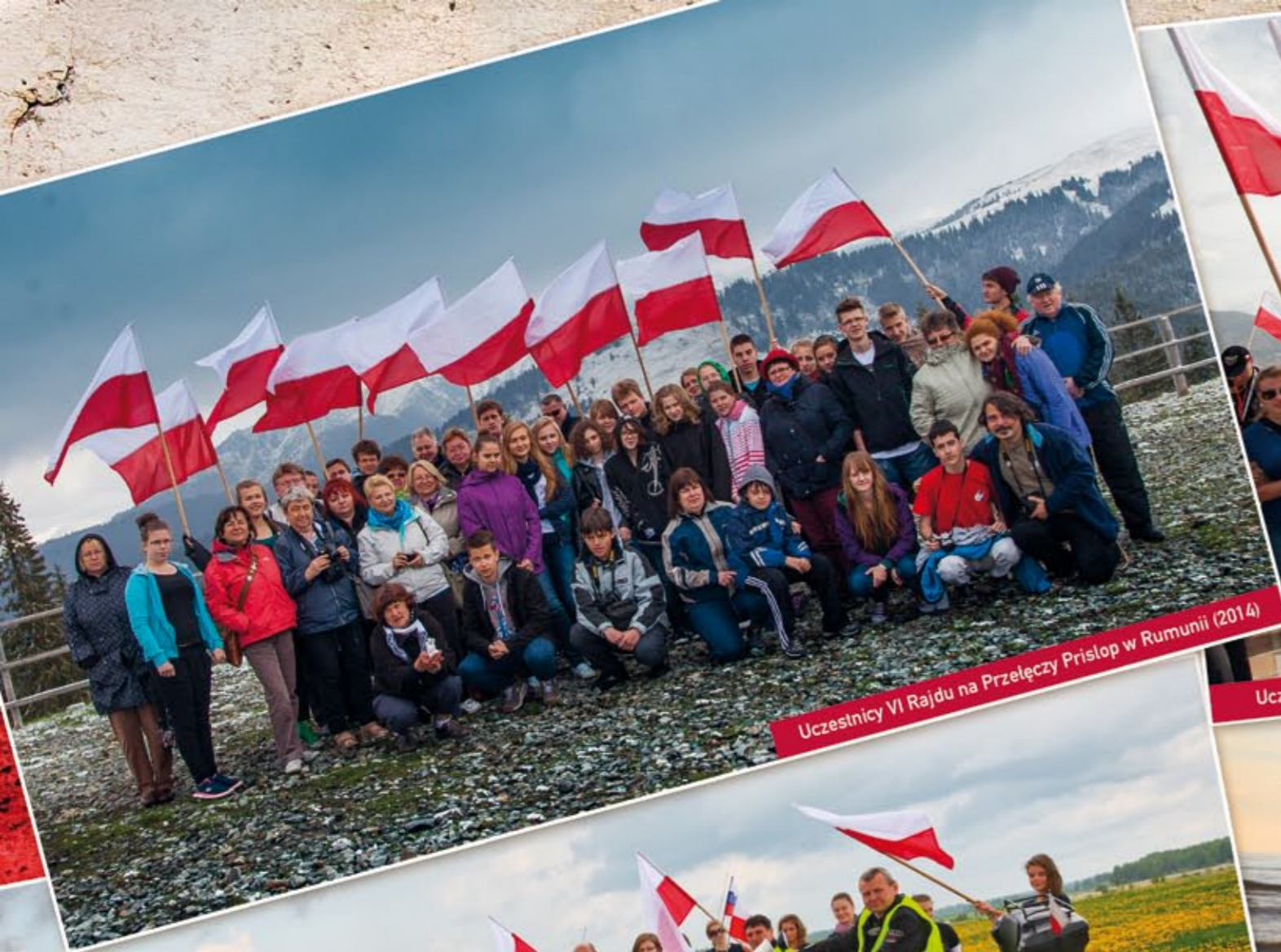
Uczestnicy VI Rajdu na Przełęczy Prislop w Rumunii (2014)