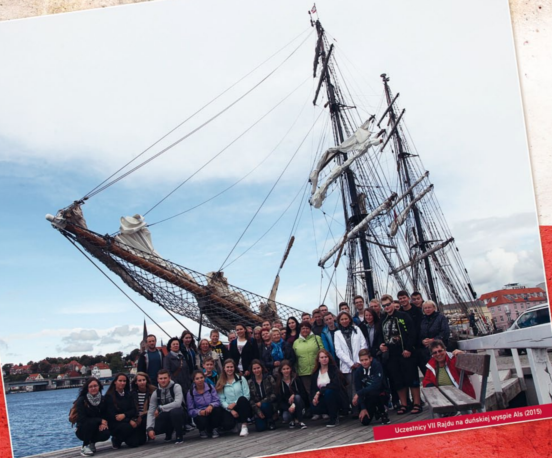
Uczestnicy VII Rajdu na duńskiej wyspie Als (2015)

Dom Kultury „Zacisze” w Dzielnicy Targówek i Zespół Szkół nr 41 w Warszawie