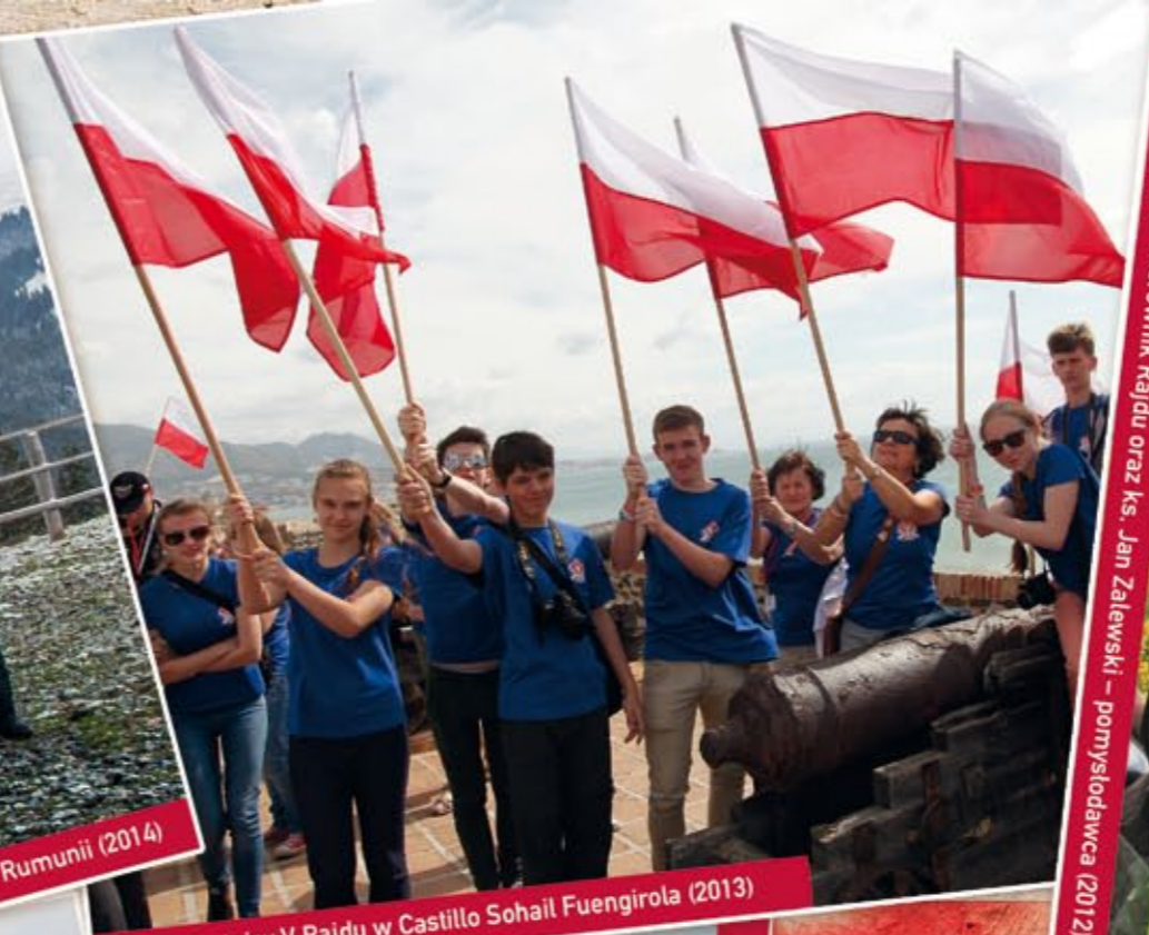
Uczestnicy V Rajdu w Castillo Sohail Fuengirola (2013)